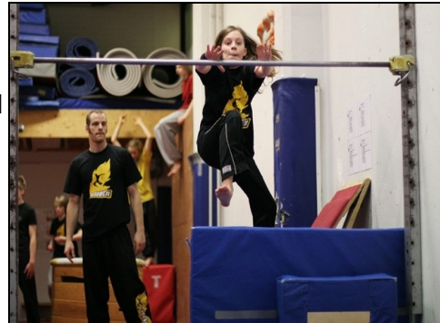
Akatemian opetusta sisällä

Jyväskylässä melkoisen suosion saavuttanut Parkour Akatemia järjestää nuorille ja lapsille suunnattuja parkour-toimintaleirejä kesäkuussa. Ilmoittautuminen on jo alkanut ja mukaan mahtuu vielä!